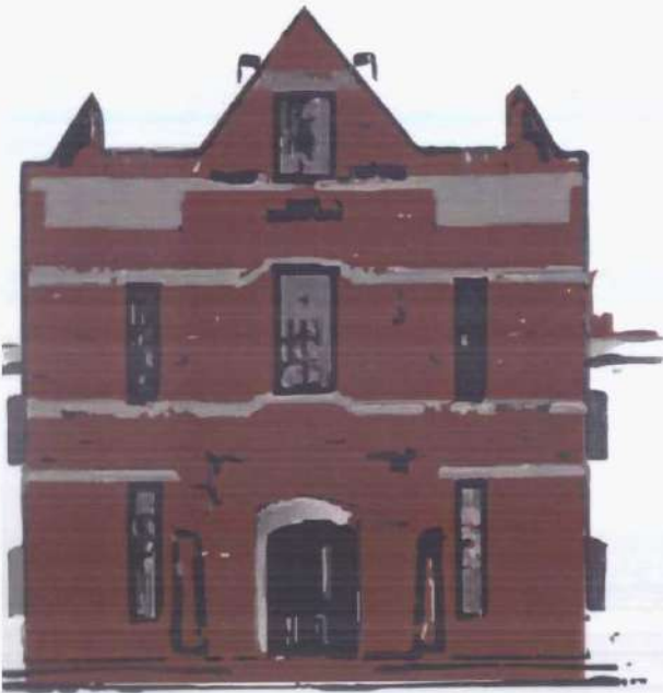
جمعية نادي خريجي خضوري